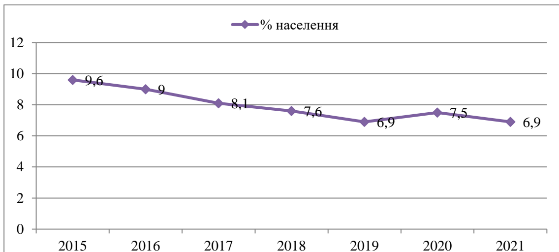
Рисунок 2 – Населення ЄС, яке не в змозі належним чином обігріти свої домівки за 2015–2021 рр., % (складено авторами на основі даних https://ec.europa.eu/eurostat/databrowser/view/SDG_07_60__custom_1315834/bookmark/table?lang=en&bookmarkId=0ea9b04d-9185-4de1-9876-b9a96c9ee7d3 )

З розвитком виробництва і споживання енергії з відновлюваних джерел можна пов'язати зменшення відсотку населення, яке невзможі належним чином обігріти свої домівки (рис. 2).