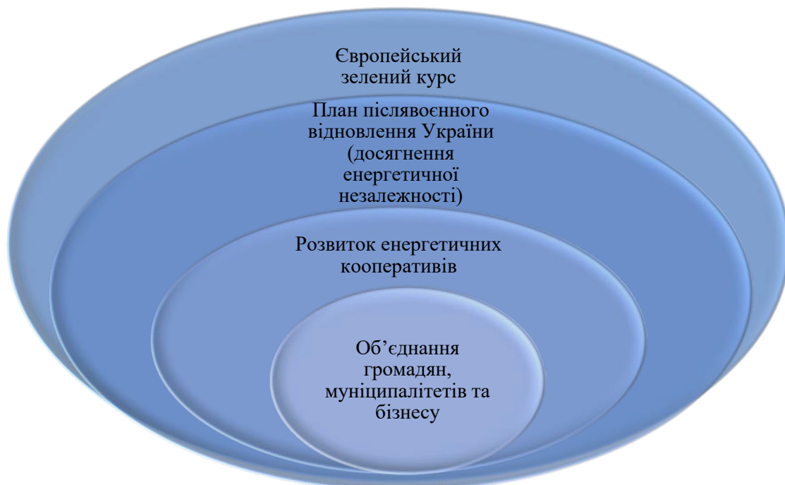
Рисунок 3 – Роль енергетичних кооперативів у досягненні Європейського зеленого курсу (складено авторами)

Розвиток енергетичних кооперативів на селі є одним із важливих складових відновлення енергетичної системи України, побудови «зеленої» економіки та досягнення Європейського зеленого курсу (рис. 3).